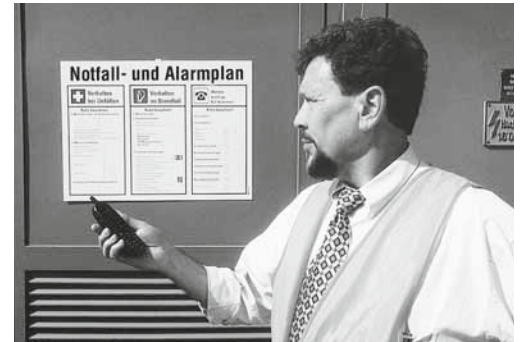
Bild 5: Die korrekte und rasche Alarmierung muss regelmässig instruiert werden.