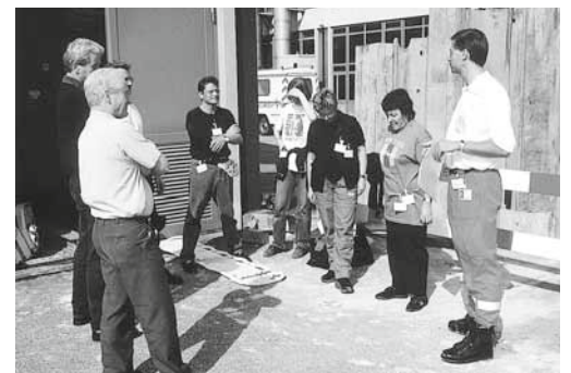
Bild 6: Das richtige Verhalten im Notfall muss regelmässig instruiert und geübt werden.